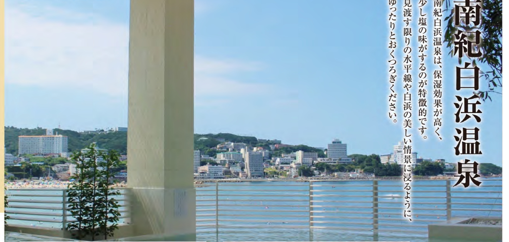
眺望の湯「潮風」露天風呂