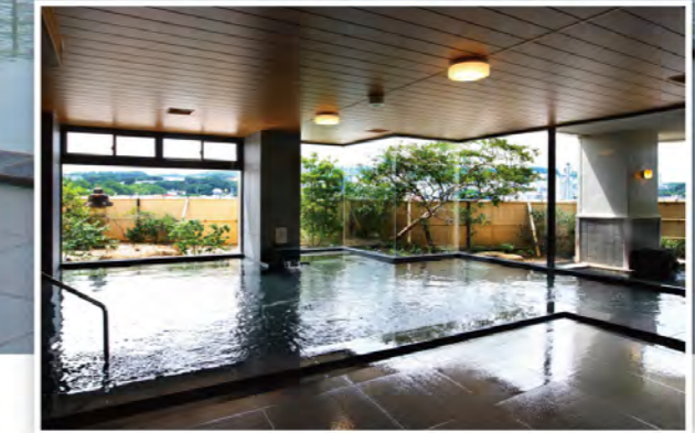
磯辺の湯「松風」大浴場