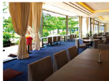
ロビーラウンジ「シュガービーチ」

全面窓ガラスの開放感あふれるロビーラウンジやレンタル浴衣コーナーなど、自由きままな旅時間をお楽しみ頂けます。