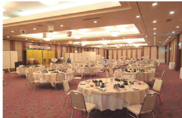
コンベンションホール