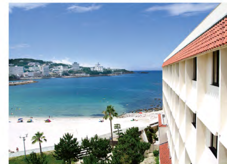
お部屋からの景観イメージ