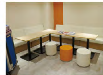
カラオケルーム「ザ・マイク」