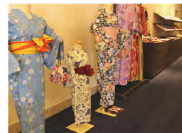
レンタル浴衣コーナー